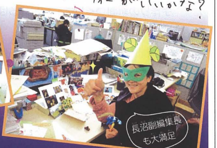
長沼副編集長も大満足