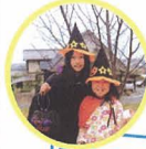
松葉可恋編集長 (池田町・6年)