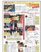
6月26日のこども新聞スペシャルでも4人のこども記者が報告してるよ!

第8回信毎こどもスクール「パックマンの先生とゲームを作ろう」遊ぼうデーが6月19日、松本市の富士電機健康保険総合体育館で開かれました。こども記者たちはビデオゲ