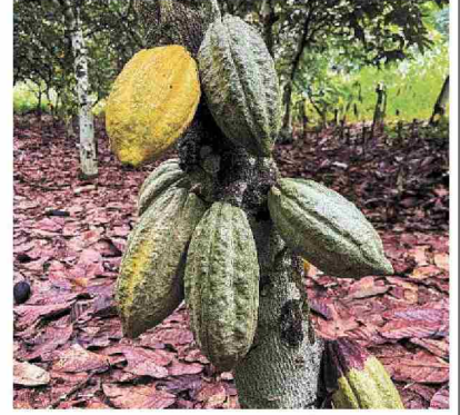
カカオの実＝2023年10月、コートジボワール（ロイター＝共同）