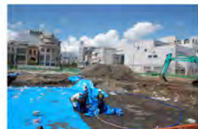
信毎の新松本本社建設地。発掘調査が進められています。

松本市のシンボルにもなっている国宝・松本城は400年以上前に建てられました。江戸時代、お城の周辺には町が栄え、町人たちが生活していました。そのころの面影が残る城下町を歩き、江戸時代の遺跡を見学します。発掘調査を行っている松本市中央2(本町)の信濃毎日新聞松本本社建設地では発掘も体験してみます。何か出てくるかな？