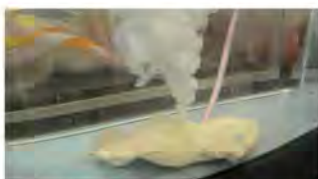
入浴剤を使って水そうの中で再現した噴火現象