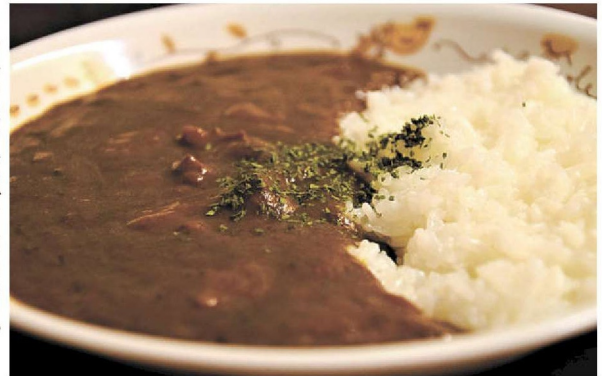
シルクホテルのビーフカレー。野菜の甘みとスパイスが特徴だ