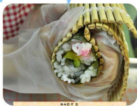
まきすで涙型にしまきす