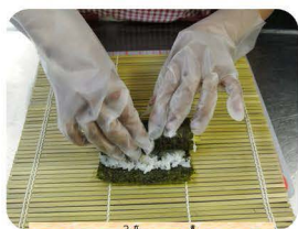
まきすも使わず巻くまきす