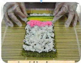
貝も手前に置いまきす