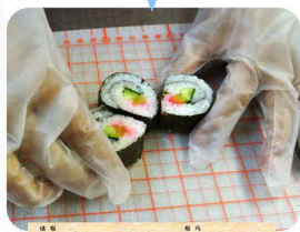
花びらのように並べまきす