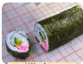
5等分に切りまきす