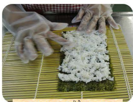
すしめしを均等に広げまきす