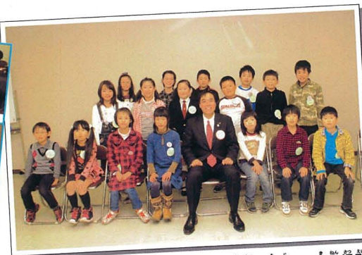
教室に参加したこども記者と知事とで記念撮影