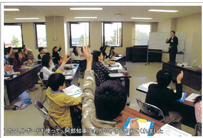
ホワイトボードも使って、阿部知事はわかりやすく答えてくれました